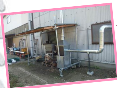
竹チップボイラー (伊藤線香工場)