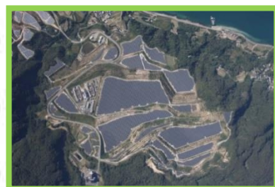
淡路貴船太陽光 発電所