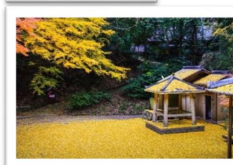
花の札所部門 優秀賞 作品名「黄色い絨毯」