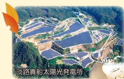
淡路貴船太陽光発電所