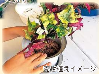
寄せ植えイメージ