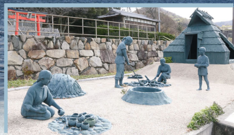
淡路の海人の土器製塩の様子（貴船神社遺跡 / 淡路市）

古代国家を支えた淡路の海人の営みはどのようなものであったか。 今回は、日本遺産に認定された島内の様々な文化財から見えてくる 海人の具体的な姿にせまります。