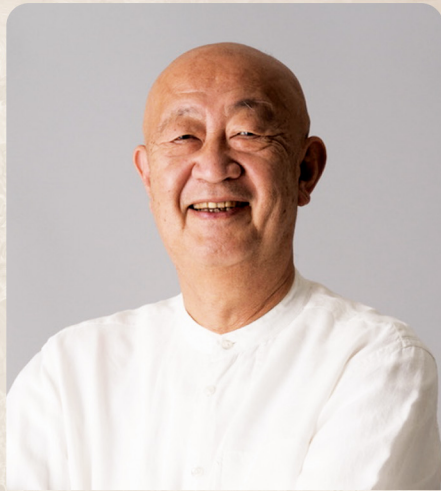
講師プロフィール

1954年大阪生まれ。京都大学総合人間学部教授、神戸大学海洋底探査センター教授などを経て2021年4月から現職。