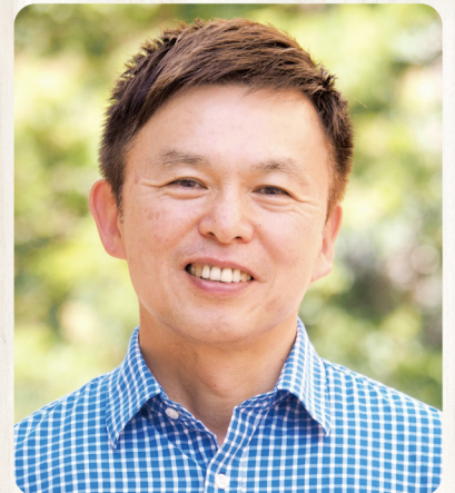
講師プロフィール

1961年、兵庫県尼崎市生まれ。早稲田大学を卒業後、1986年株式会社ウエザーニューズへ入社。