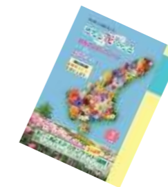
↑四季のスタンプブック ←スタンプラリー チラシ